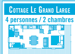
COTTAGE LE GRAND LARGE 4 personnes / 2 chambres

20 m², avec perron, coin salon, 2 chambres (1 chambre lit double, 1 chambre 2 lits simples superposés), salle d'eau, WC séparé, un coin cuisine. Salon de jardin, 2 bains de soleil, parasol.